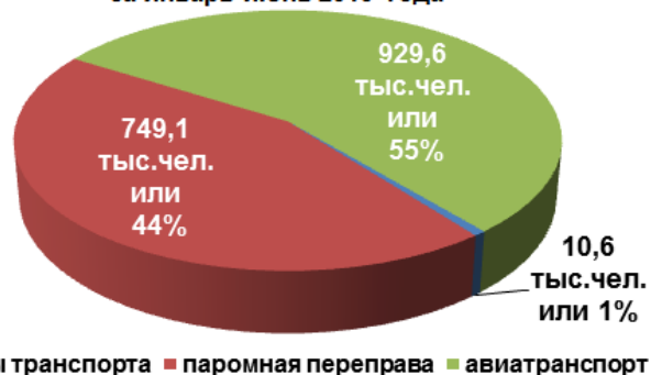
Структура пассажиропотока в Крым за январь-июнь 2015 года

Справочно: за аналогичный период 2014 года 55% всех отдыхающих приехали в Крым ж/д транспортом, 20% туристов – авиатранспортом и 25% – через Керченскую паромную переправу.