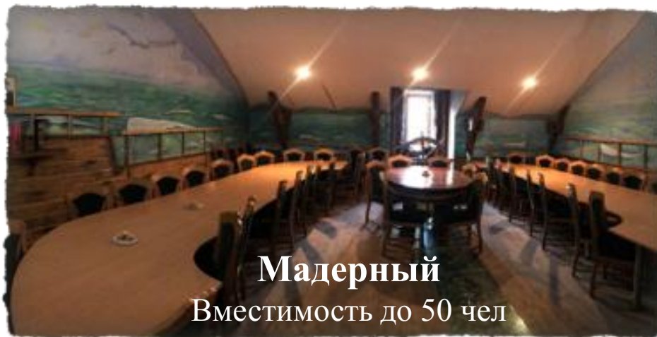
Мадерный Вместимость до 50 чел