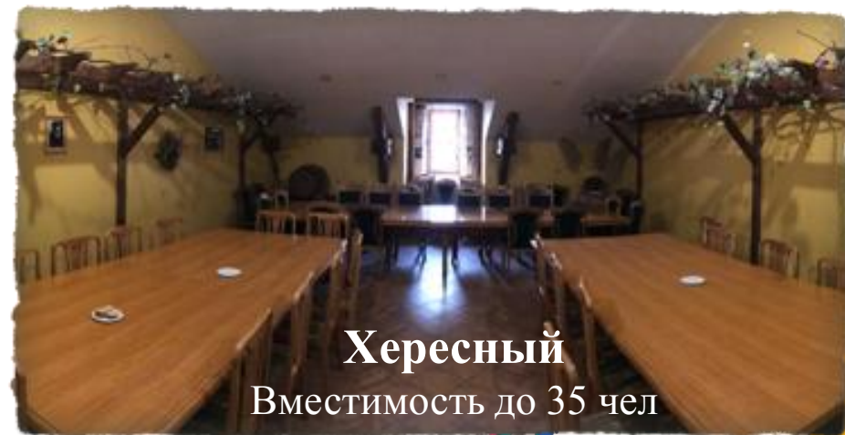
Хересный Вместимость до 35 чел