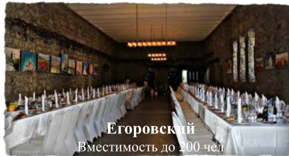
Егоровский Вместимость до 200 чел