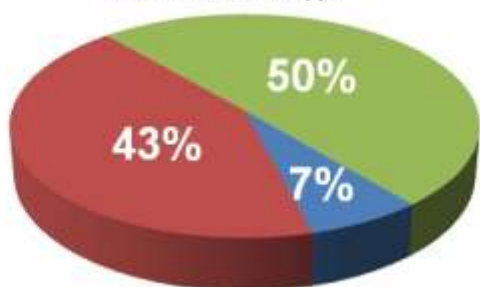
Структура турпотока в Крым по видам транспорта с начала 2017 года

■ др. виды транспорта (в т.ч. ж/д) ■ паромная переправа ■ авиатранспорт