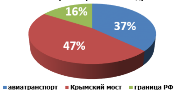
Структура турпотока в Крым по видам транспорта в 2018 году

За 2018 год в Крыму отдохнуло 6,8 млн. туристов , что на 28% выше, чем за 2017 год.