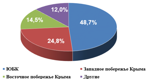
Распределение туристов по регионам Крыма с начала 2019 года

Больше всего туристов с начала года отдохнуло на Южном берегу Крыма – 48,7% от общего количества туристов, отдохнувших с начала года в Крыму в целом, на Западном побережье Крыма – 24,8% ; на Восточном побережье Крыма – 14,5% ; в других регионах (г. Симферополь, Симферопольский и Бахчисарайский районы) – 12% .